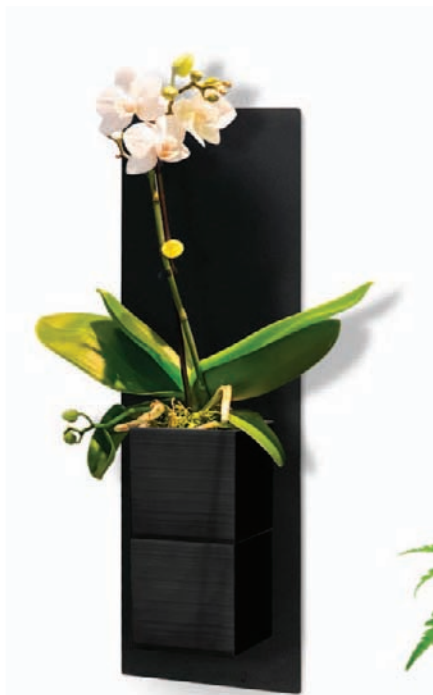
Plaque murale SOLO