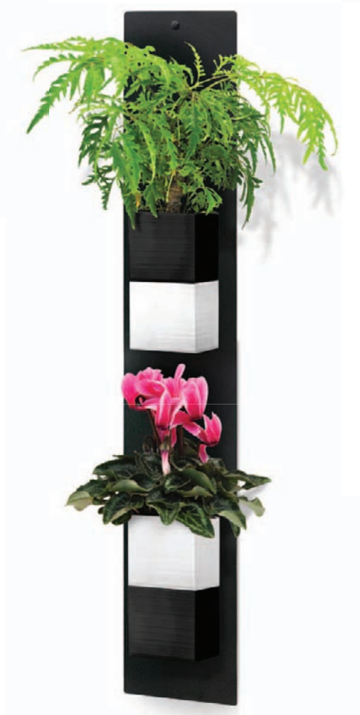
Plaque murale DUO