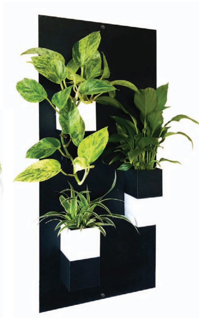
Plaque murale TRIO